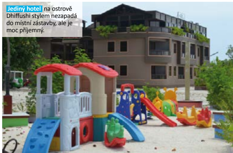
Jediný hotel na ostrově Dhiffushi stylem nezapadá do místní zástavby, ale je moc příjemný.

“ Co se tady dá podniknout? Odpověď je jasná: potápět a šnorchlovat! “