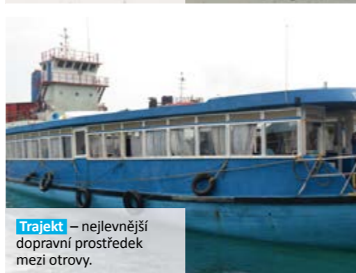
Trajekt – nejlevnější dopravní prostředek mezi ostrovy.