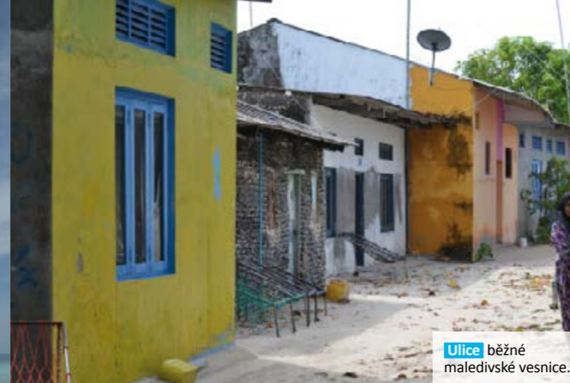
Ulice běžné maledivské vesnice.