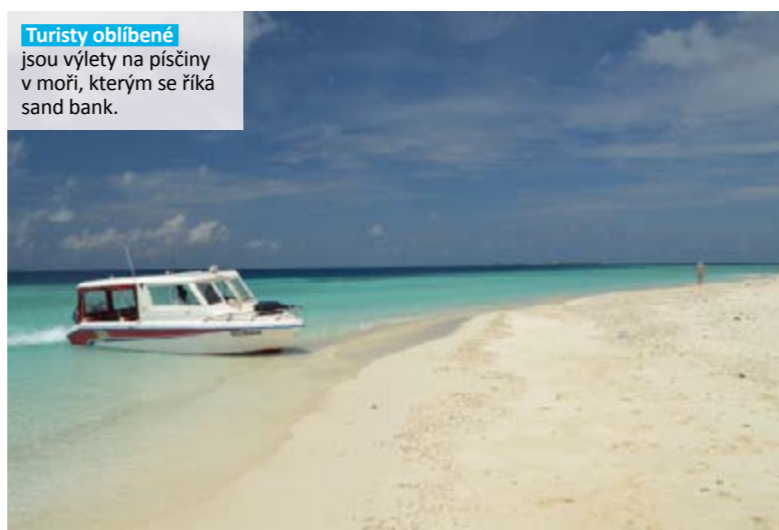
Turisty oblíbené jsou výlety na písčiny v moři, kterým se říká sand bank.