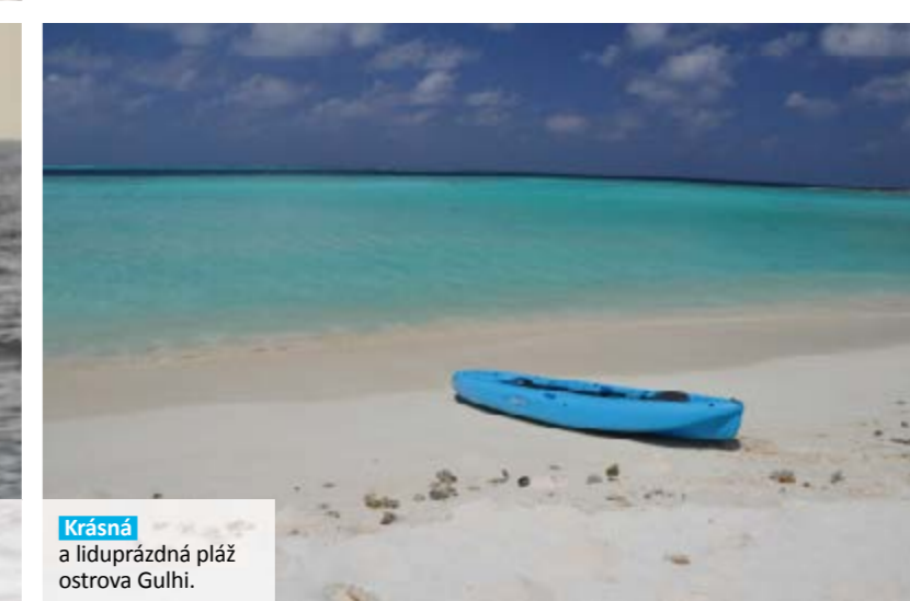
Krásná a liduprázdňá pláž ostrova Gulhi.