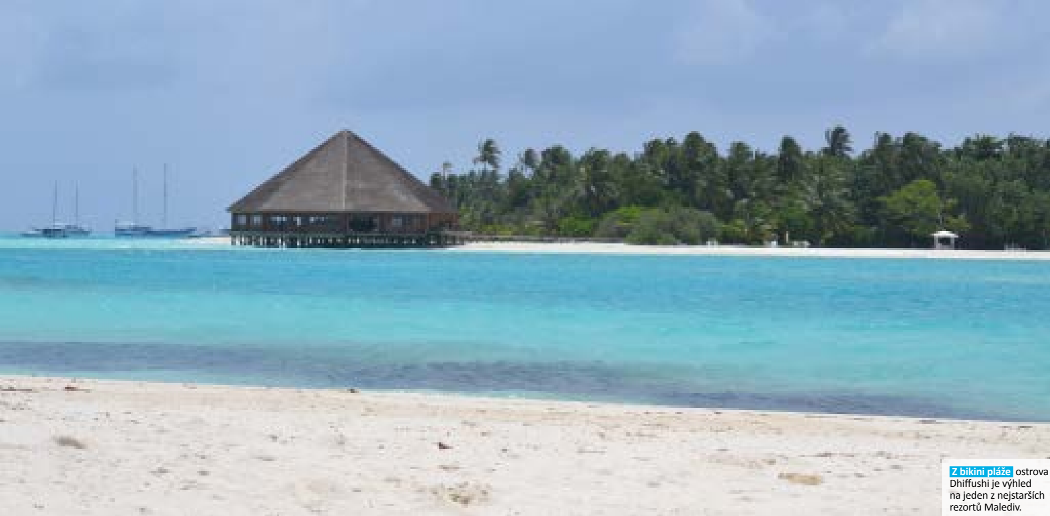
Z bikini pláže ostrova Dhiffushi je výhled na jeden z nejstarších rezortů Malediv.

“ Co se tady dá podniknout? Odpověď je jasná: potápět a šnorchlovat! “