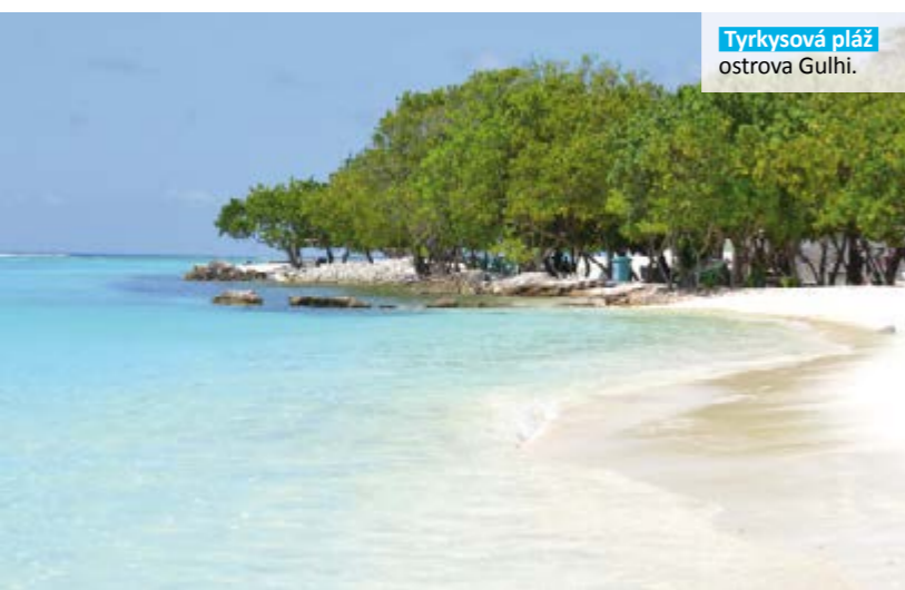
Tyrkysová pláž ostrova Gulhi.