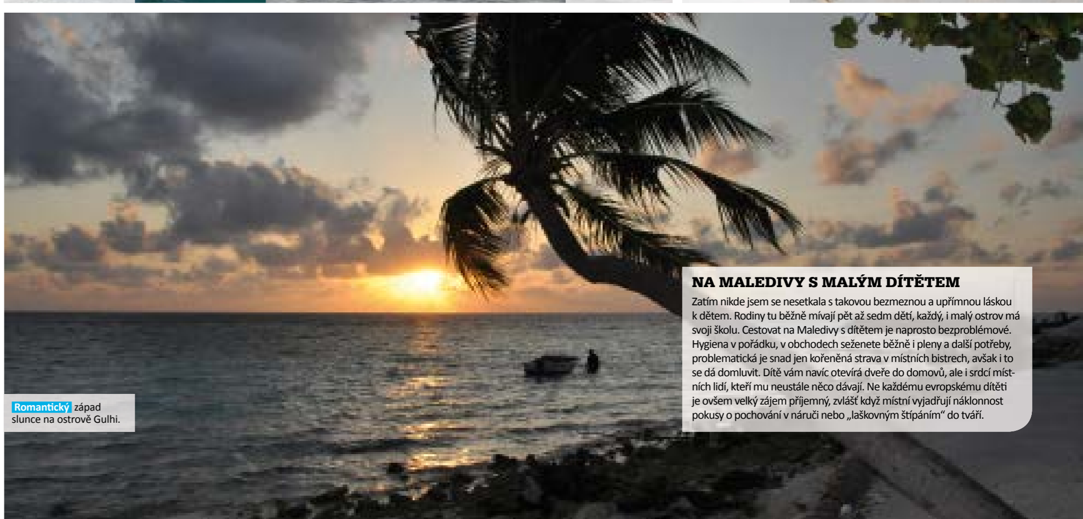
Romantický západ slunce na ostrově Gulhi.

„Žraloci nám kusy ryb trhali z ruky jako diví, zato rejnoci si rybu jen jemně ukusovali.“