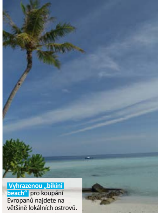
Vyhrazenou „bikini beach“ pro koupání Evropanů najdete na většině lokálních ostrovů.