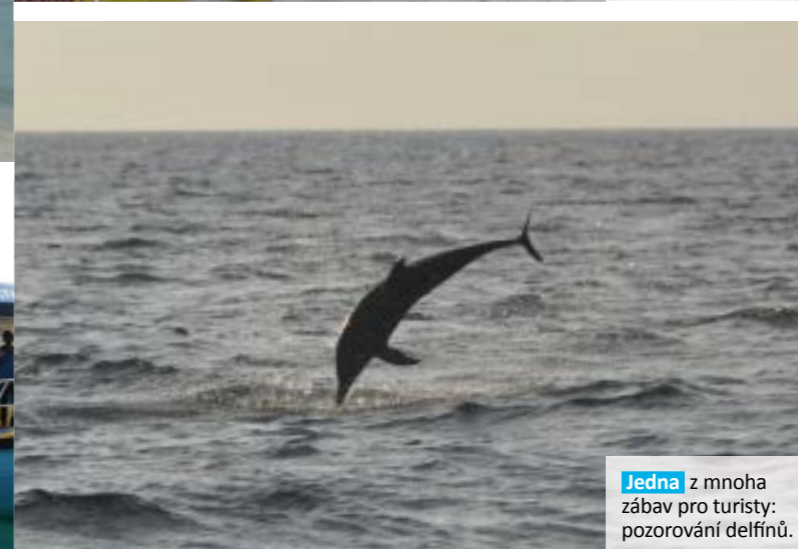
Jedna z mnoha zábav pro turisty: pozorování delfinů.