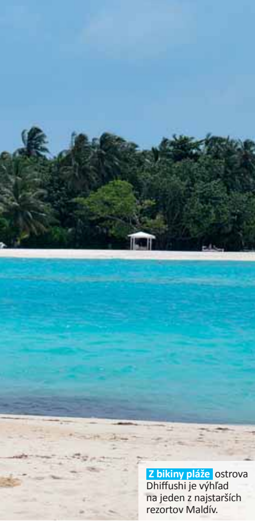
Z bikiny pláže ostrova Dhiffushi je výhľad na jeden z najstarších rezortov Maldiv.