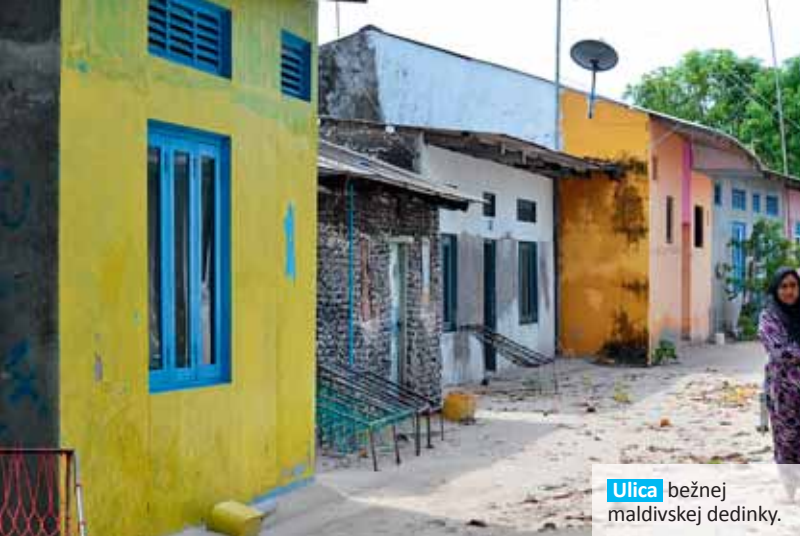
Ulica bežnej maldivskej dedinky.

„Žraloky nám kusy rýb trhali z ruky ako divé, zato raje si rybu len jemne odhrýzali.“