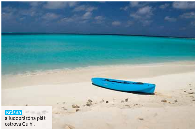
Krásna a ľudoprázdna pláž ostrova Gulhi.