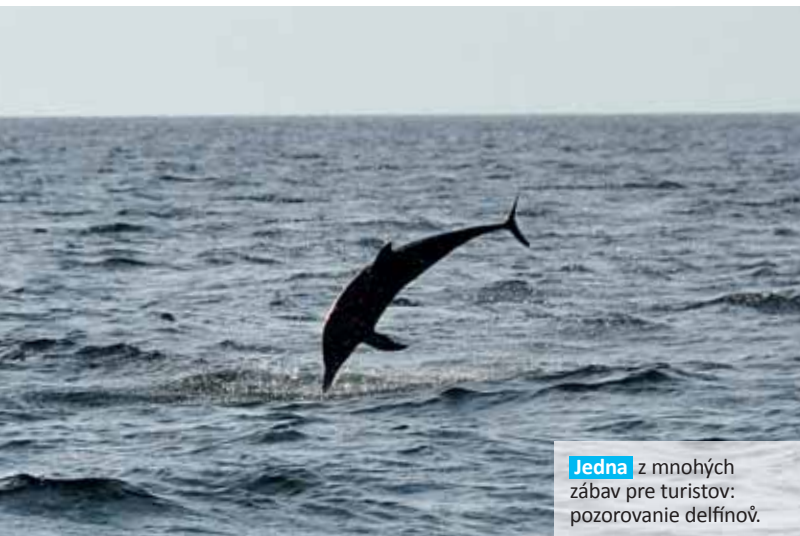
Jedna z mnohých zábav pre turistov: pozorovanie delfínov.

„Žraloky nám kusy rýb trhali z ruky ako divé, zato raje si rybu len jemne odhrýzali.“