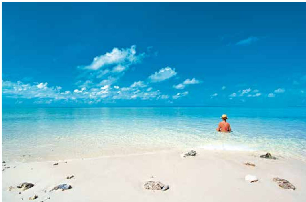
► Nahoře: „Bikiny“ pláž pro turisty na ostrově Thinadhoo ► Dole: Vesnička na Dhigurahu. S příchodem turistů na ostrovech zesílil úklid odpadků.